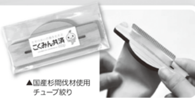
▲国産杉間伐材使用 チューブ絞り