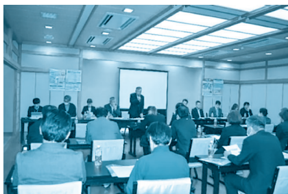
佐賀地区・神埼地区合同地区推進会議の様子