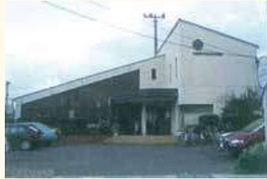
太閤テニスクラブ 唐津市大名小路2-50 ☎0955-74-4331