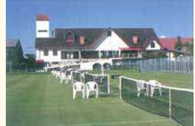
グラスコート佐賀テニスクラブ 佐賀市金立町千布3907 ☎0952-98-2241 ※1クール(2ヶ月)分とする。